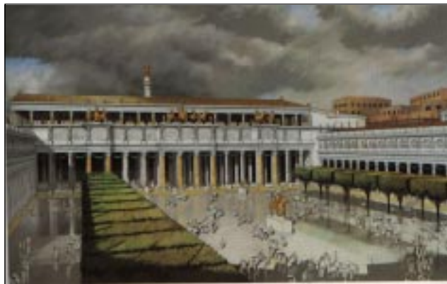
În 2012 se împlinesc 1900 de ani de la inaugurarea Forului lui Traian (foto) și 1925 de ani de la urcarea pe tronul de la Sarmizegetusa a regelui dac Decebal

popor de războinici «redutabili», care a fost cu greu învins de romani și care a dat prin urmare atâția militari de valoare pentru legiunile Imperiului roman, nu putea fi ignorat de iconografia antică romană. Dacă se adaugă acestui fapt și importanta pradă de război adusă de romani din Dacia, incomensurabilele bogății care au salvat în mod practic Imperiul roman de la dezastru economic, se înțelege pentru ce Romanii au fost atât de «recunoscători» față de cei pe care îi învinseseră. Se poate deci considera că împăratul Traian a dedicat acest monument important (Forul) de asemenea și daco-geților, reprezentându-i în arta oficială romană, fiind un fapt cu totul excepțional. Daco-geții au fost înfrânți dificil de romani în timpul domniei lui Traian (98-117 d.Hr.), ei au pierdut o parte din țara lor, din teritoriul Daciei, și o cantitate însemnată din aurul și agoniseala lor, luate de romani ca pradă de război,